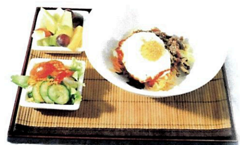
Veg. Bibimbab mit Spiegelei