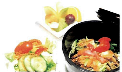
Mix Don. versch. roher Fisch