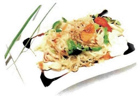
Gebr. Nudeln mit Hühnerfleisch