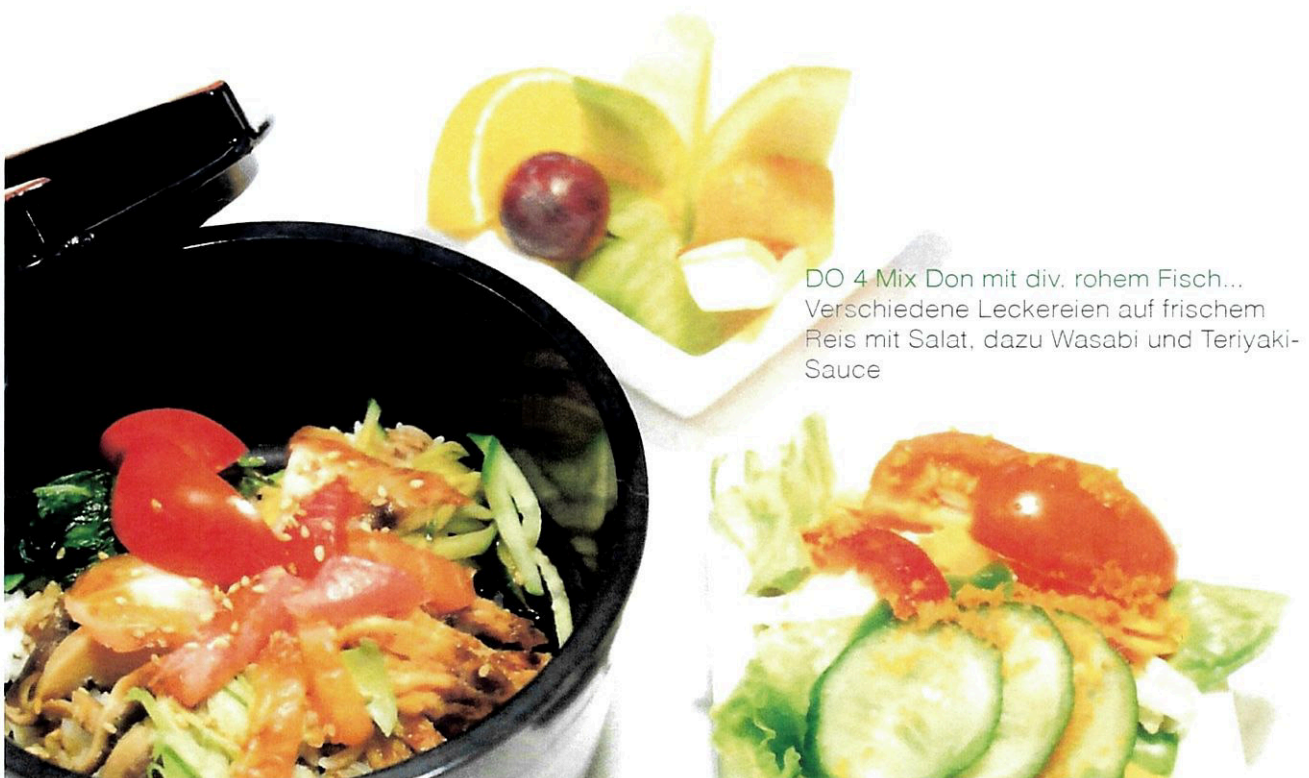
DO 4 Mix Don mit div. rohem Fisch... Verschiedene Leckereien auf frischem Reis mit Salat, dazu Wasabi und Teriyaki- Sauce